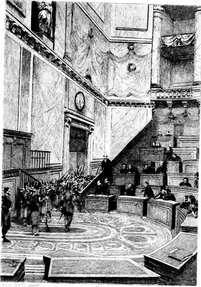
LA CHAMBRE ENVAHIE